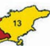
Ilustração extraída do Programa de Governo de Aloizio Mercadante 2010