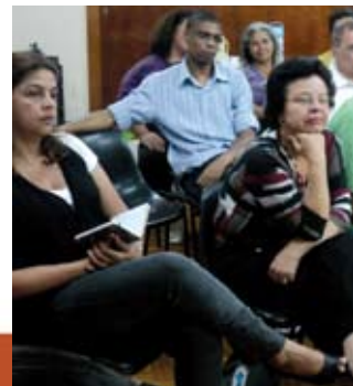
Conselho político da cidade de São Paulo

Quando o serviço de Saúde é desvirtuado para atender aos interesses dos Planos de Saúde, lá está