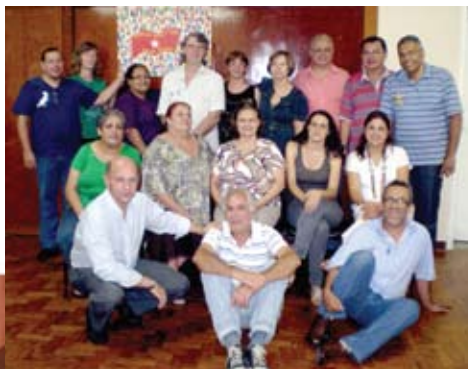
Conselho político norte/noroeste

Também nasceu do diálogo do parlamentar com profissionais de saúde e a população negra a lei municipal que cria o Programa de Prevenção à Anemia Falciforme. Esta é a primeira lei que trata desta patologia que atinge grande parcela da população, em especial os afro-descendentes.